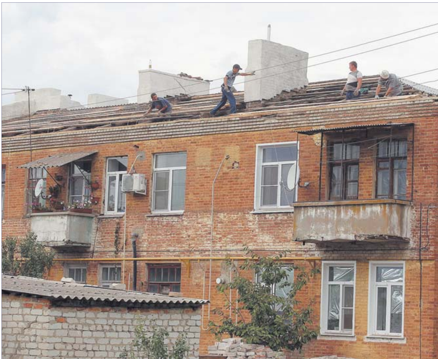
■ Так выглядел дом до ремонта.

Жильцы решили софинансировать его капитальный ремонт