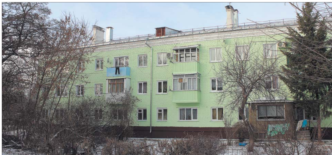
■ Вот так теперь выглядит обновленная трехэтажка.